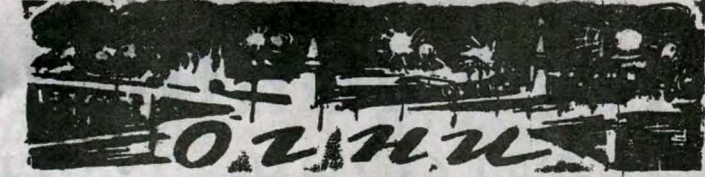
Слова А. БАРТО.

Удивительно ли, что молодежь, которая сама строила Сталинградский тракторный завод, которая работала в пеклах этого завода, удивительно ли, что она до последнего вздоха защищала свой завод от гитлеровских захватчиков?