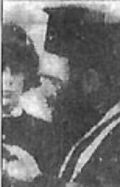
A woman in a dark hat and light jacket.

By NORMAN KRASNA The Supreme Court has bravely stood up to the censorship of plays.