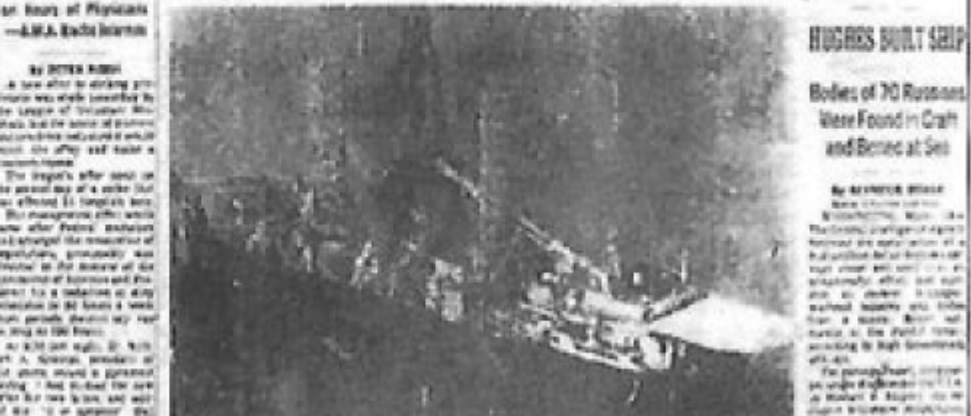
The Ocean Explorer, which was used to bring up wreckage of a Soviet submarine from the Pacific Ocean.