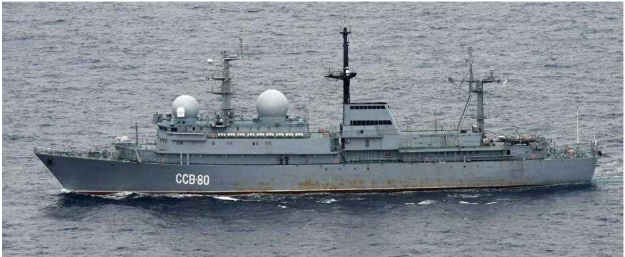
バルザム級情報収集艦（艦番号「80」）