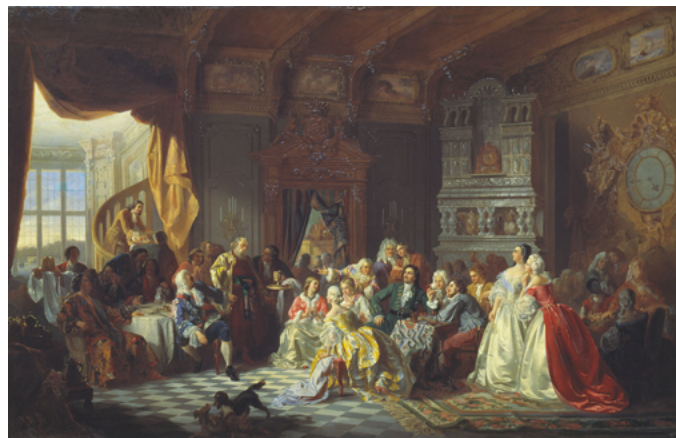
Станислав Хлебовский. Ассамблея при Петре I

ты, пообщаться с дамами, что, кстати, было нововведением, но и переговорить о делах — гостями были дворяне, офицеры и знатные купцы.