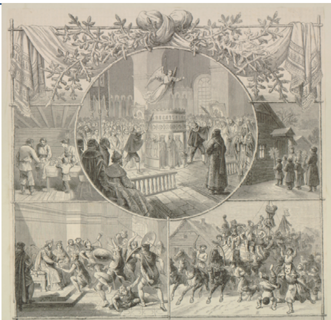
Празднование Рождества Христова и Нового года при Петре Великом

На Красной площади был устроен фейерверк, пушечные и ружейные салюты, а москвичам было велено стрелять из мушкетов и пускать ракеты возле своих домов. 6 января празднества окончились крестным ходом на Иордань. Вопреки старинному обычаю, царь не шел за духовенством в богатом облачении, а стоял на берегу Москвы-реки в мундире в окружении Преображенского и Семеновского полков, одетых в зеленые кафтаны и камзолы с золотыми пуговицами и позументом. Боярам и служилым людям было велено облачиться в европейские костюмы — венгерские кафтаны. И женщины должны были быть также одеты в иноземное платье.