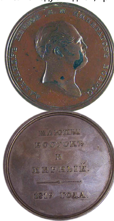
Медаль антарктической экспедиции 1819–1821 годов. (ЦВММ)

60-й параллели и 100 дней во льдах. Помимо географических открытий (материк Антарктида и 29 островов), экспедицией была сделана масса интересных и ценных астрономических, океанографических, синоптических и этнографических наблюдений. ⚓