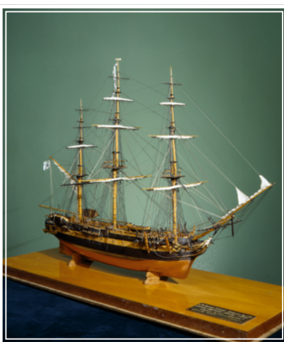
Модель шлюпа «Восток»

4 (16) июля 1819 г. экспедиция в составе 2 шлюпов под командованием капитана 2 ранга Ф. Ф. Беллингаузена вышла из Кронштадта в Рио-де-Жанейро. Экипажи были укомплектованы военными моряками-добровольцами. Шлюпом «Восток» командо-