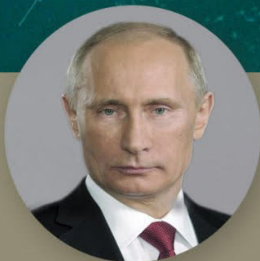
Владимир Владимирович Путин

ЕЖЕНЕДЕЛЬНАЯ ГАЗЕТА ГЛАВНОГО КОМАНДОВАНИЯ ВМФ №06(100) 14.02.2025