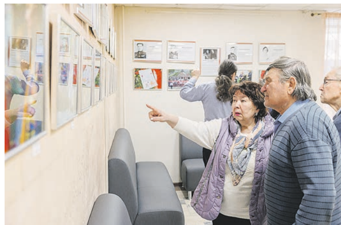
Посетители выставки «Летописи Победы»

В фойе Троицкого центра культуры и творчества новая экспозиция. Стены холла украсили портреты и биографии участников Великой Отечественной войны, а также снимки, на которых можно увидеть, как отмечали 9 Мая в Троицке в разные годы.