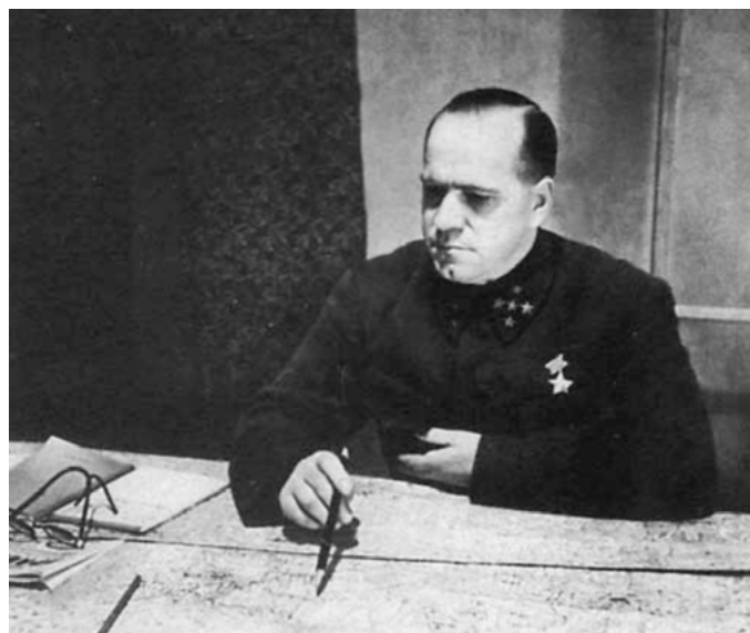
Маршал Жуков в октябре 1941 года. Фото опубликовано в газете «Красная звезда» по личному указанию Сталина

26 сентября 107-я и 120-я стрелковые дивизии, также участвовавшие в этой операции, были преобразованы в 5-ю и 6-ю гвардейские.