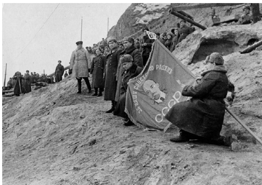
Командование 62-й армией вручает гвардейское знамя командованию 39-й гвардейской стрелковой дивизии на берегу реки Волги у завода «Красный Октябрь». 3 января 1943 г.