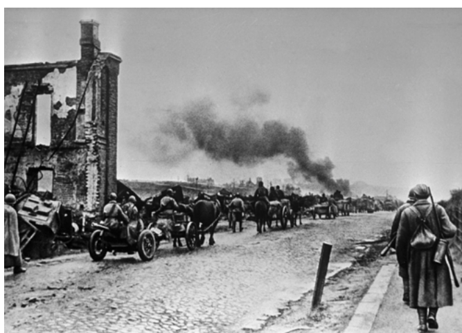
Советские войска вступают в Ельню, 1941 г.