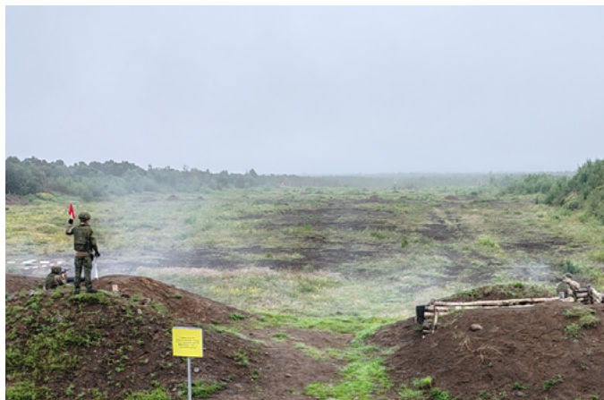
Контрольное тактико-специальное занятие с отдельной морской инженерной

ротой Тихоокеанского флота прошло на полигоне «Радыгина» на Камчатке. В рамках планового мероприятия боевой подготовки военнослужащие отработали нормативы по различным предметам в одиночном порядке и в составе подразделений.