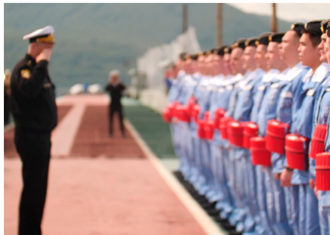
Атомный ракетный подводный крейсер стратегического назначения «Импера-

тор Александр III» Тихоокеанского флота успешно завершил выполнение поставленных боевых задач в зоне ответственности флота и вернулся в пункт базирования на Камчатке.