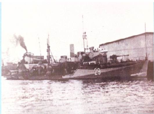
Пограничный сторожевой корабль СКР-29 «Бриллиант»

23 сентября 2025 года у памятного знака «Якорь» кировским военным морякам и речникам за службу Родине, Отечеству в Первомайском районе г. Кирова прошел День памяти экипажа СКР -29 «Бриллиант».