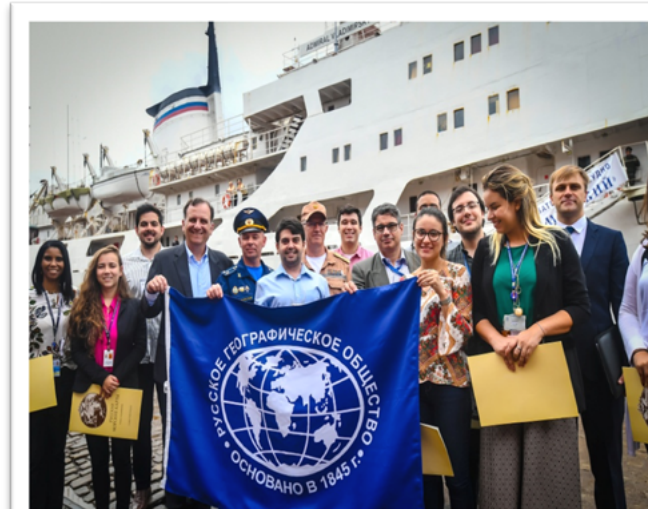
Океанографическая экспедиция на оис «Адмирал Владимирский». 2020 г.

В октябре 2025 года завершилась мемориальная экспедиция Русского географического общества и Тихоокеанского флота на остров Врангеля, приуроченная к 100-летию установки там советского флага. Специалисты обновили памятную табличку, а также заложили новую капсулу