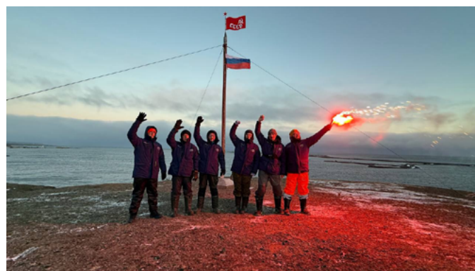
Экспедиция РГО и ТОФ на остров Врангеля. Октябрь 2025 г.

времени с письмом, которое прочтут будущие поколения через 50 лет.