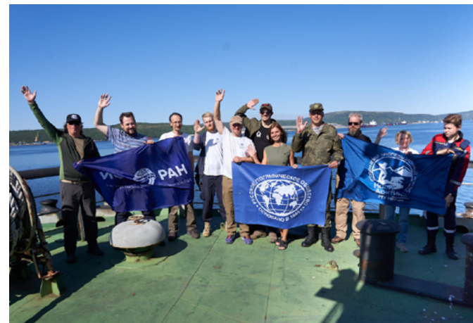
Комплексная экспедиция СФ и РГО на архипелаг Новая Земля. 2024 г.