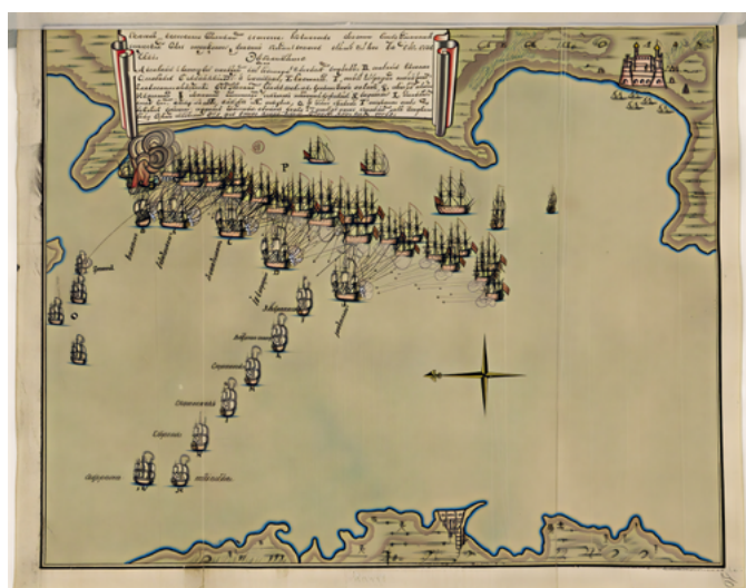
Схема Хиосского сражения 24 июня 1770 г. (РГА ВМФ)

жениях Семилетней войны, завершив ее в чине лейтенанта. В первый период службы в России Грейг командовал несколькими кораблями Балтийского флота, в том чис-