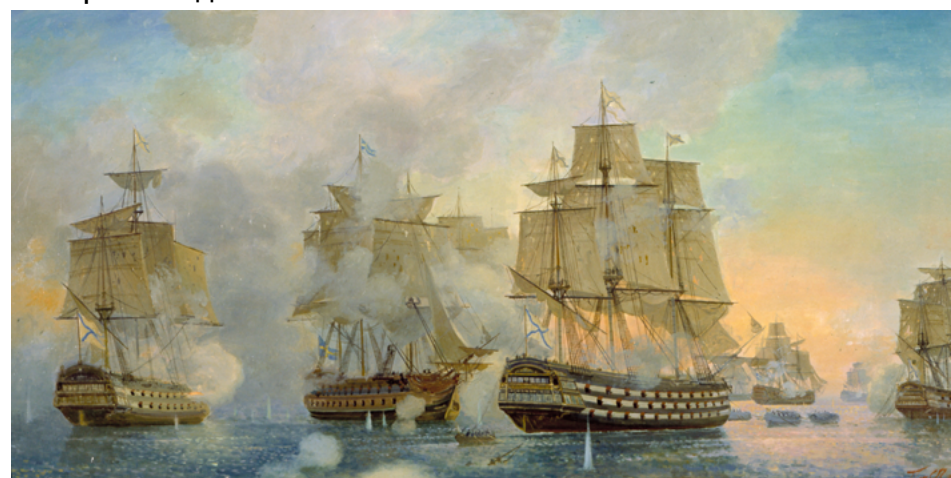
С. В. Пен. Гогландское сражение 1788 года. (ЦВММ)