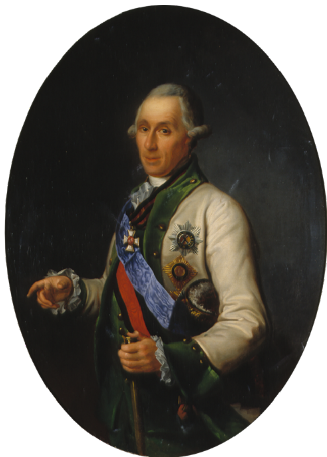
Неизвестный художник. Портрет адмирала С. К. Грейга. (ЦВММ)

жениях Семилетней войны, завершив ее в чине лейтенанта. В первый период службы в России Грейг командовал несколькими кораблями Балтийского флота, в том чис-