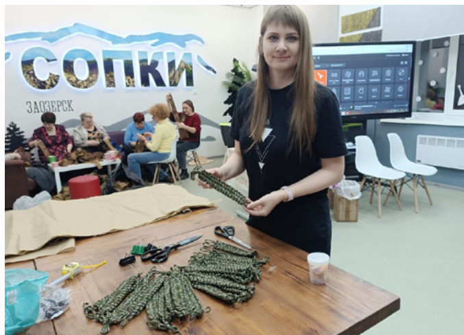
ВОЛОНТЕРЫ МУРМАНСКОЙ ОБЛАСТИ ОТПРАВИЛИ ПАРТИЮ ГРУЗА ДЛЯ ГРУППИРОВКИ ВОЙСК «СЕВЕР»

«Наше дело правое! Победа будет за нами!» – с таким настроем продолжают поддерживать наших защитников волонтеры из Владивостока.