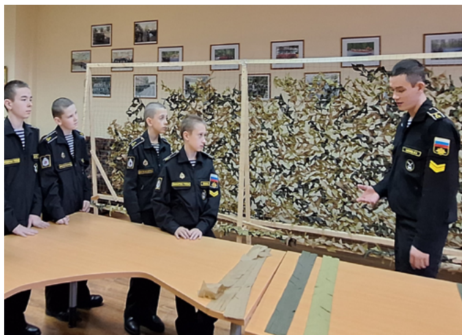
КАДЕТЫ КРОНШТАДТСКОГО МОРСКОГО КОРПУСА СПЛЕЛИ МАСКИРОВОЧНЫЕ СЕТИ ДЛЯ БОЙЦОВ СВО

Акция «Посылка солдату» стала важным мостом между нахимовцами и бойцами на передовой, напоминая каждому из них: их помнят, в них верят и их ждут дома.