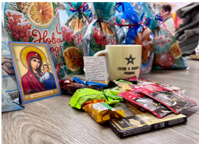
ЖИТЕЛИ КАЛИНИНГРАДСКОЙ ОБЛАСТИ СОБРАЛИ ПОМОЩЬ ДЛЯ БОЙЦОВ СВО И РАНЕННЫХ ВОЕННОСЛУЖАЩИХ

Координаторы волонтерских движений рады видеть новых помощников и готовы научить всех желающих создавать вещи для поддержки бойцов в зоне проведения СВО.