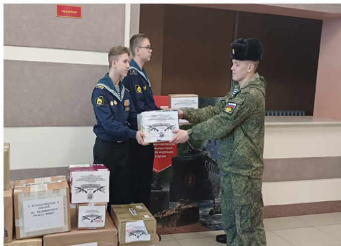
НАХИМОВЦЫ ВЛАДИВОСТОКА ОТПРАВИЛИ ПОСЫЛКИ МОРСКИМ ПЕХОТИНЦАМ – УЧАСТНИКАМ СВО

Посылки и письма, написанные нахимовцами, были переданы морским пехотинцам Краснознаменного Тихоокеанского флота. Каждая посылка – это знак благодарности, веры и поддержки от будущих офицеров тем, кто сегодня защищает Родину.