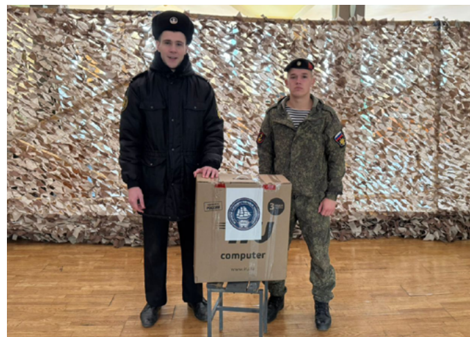
СТУДЕНТЫ МОРСКОГО УНИВЕРСИТЕТА СОБРАЛИ ПОСЫЛКИ ДЛЯ МОРПЕХОВ 155-Й БРИГАДЫ

Младшие кадеты 6 класса с интересом освоили азы изготовления средств маскировки. Мероприятие прошло в дружеской и рабочей атмосфере и стало частью регулярной патриотической работы корпуса по поддержке бойцов СВО.