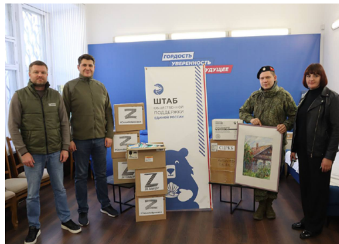
В КРЫМУ ВОЛОНТЕРЫ ПЕРЕДАЛИ ПОМОЩЬ БОЙЦАМ ИЗ РЕГИОНА, УЧАСТВУЮЩИМ В СВО

Все собранные грузы доставят адресатам в течение недели: маскировочные сети – на передовую, а подарки – в военные госпитали, чтобы поддержать бойцов на пути к выздоровлению.