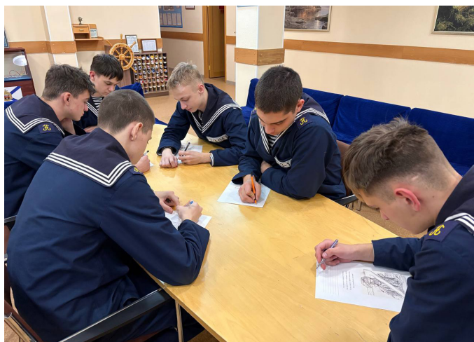
НАХИМОВЦЫ НАПИСАЛИ ПИСЬМА СОЛДАТАМ И СОБРАЛИ ПОМОЩЬ ДЛЯ МОРПЕХОВ

Воспитанники филиала НВМУ в Севастополе поддержали участников СВО.