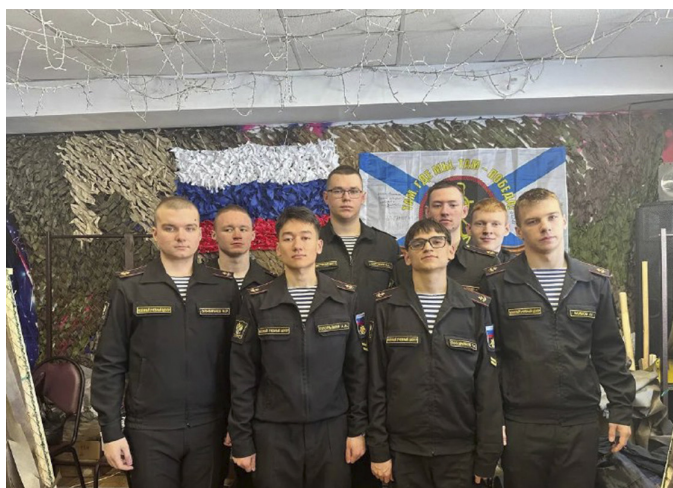
КУРСАНТЫ И ВОЛОНТЕРЫ КАМЧАТКИ ИЗГОТОВИЛИ МАСКИРОВОЧНЫЕ СЕТИ ДЛЯ МОРСКОЙ ПЕХОТЫ

Кроме того, на учебном курсе организовали сбор средств. Финансовая помощь будет направлена военнослужащим 810-й отдельной гвардейской бригады морской пехоты ЧФ.