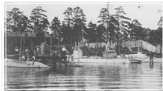
Либавский учебный отряд подводного плавания

три недели после приказа №52, 27.03 1906 г. (9 апреля по новому стилю) в Либаве (Лиепая) был официально создан первый в России учебный отряд подводного плавания. Целью отряда была подготовка кадров подводников, приемка подводных лодок от промышленности, их укомплектование, ввод в строй. Базировался отряд на порт импера-