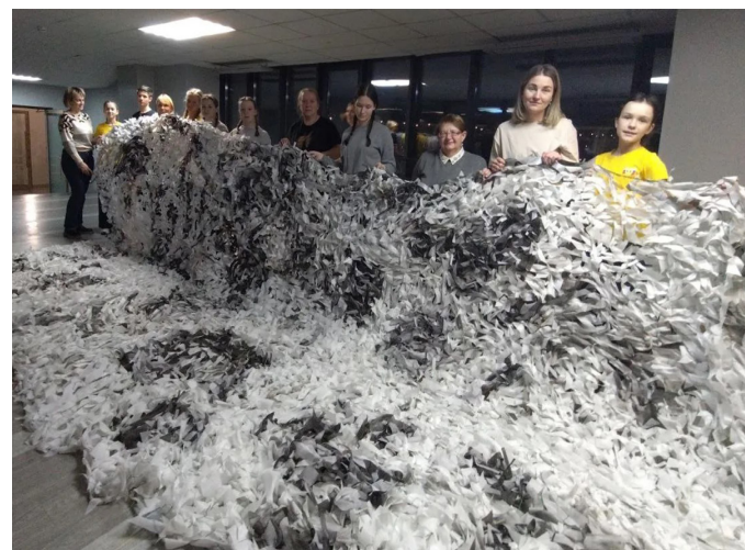
ВОСПИТАНИЦЫ САНКТ-ПЕТЕРБУРГСКОГО ПАНСИОНА ИЗГОТАВЛИВАЮТ МАСКЕТИ ДЛЯ НУЖД ФРОНТА

Всего бойцам СВО было передано более 550 кг различного имущества необходимого при ведении боевых действий в зимних условиях.