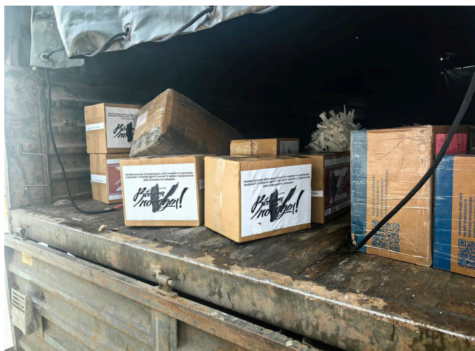
ВУЦ И КАФЕДРА «ФИЗИЧЕСКОГО ВОСПИТАНИЯ» МГТУ ИМ. Н.Э. БАУМАНА ОТПРАВИЛИ НА ФРОНТ ПАРТИЮ ГРУЗА В РАМКАХ АКЦИИ «ВУЗЫ ДЛЯ ФРОНТА»

По итогам двухмесячного периода учебной деятельности 2026 года воспитанники пятого класса изготовили 250 браслетов выживания, выполненных из высокопрочной нити паракорда. Готовые изделия были переданы в фонд помощи ветеранам и участникам боевых действий под названием «Время выбрало нас».