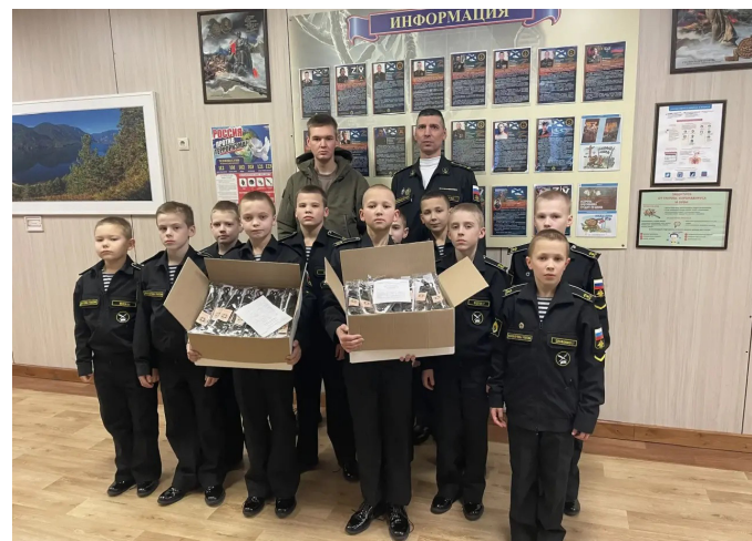
НАХИМОВЦЫ ИЗГОТАВЛИВАЮТ БРАСЛЕТЫ ВЫЖИВАНИЯ ДЛЯ ОТПРАВКИ В ЗОНУ ПРОВЕДЕНИЯ СВО

Курсанты выразили поддержку нашим защитникам, пожелав им скорейшего возвращения домой, боевой удачи и крепкого духа.