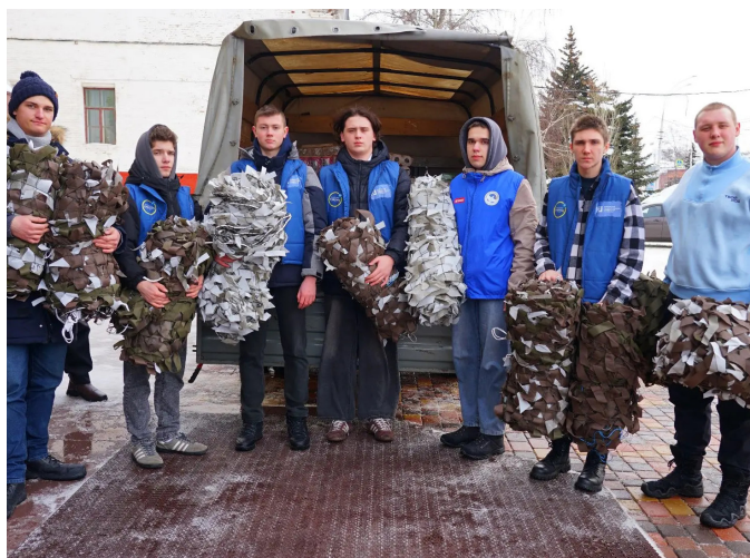
ТАМБОВСКИЙ ГОСУДАРСТВЕННЫЙ УНИВЕРСИТЕТ ОТПРАВИЛ БОЙЦАМ СВО ПАРТИЮ ДОПОЛНИТЕЛЬНОЙ ПОМОЩИ

Кроме того, на фронт доставлена очередная партия – около 200 кг. полезного груза, в состав которого вошли сладкие подарки и теплые вещи.