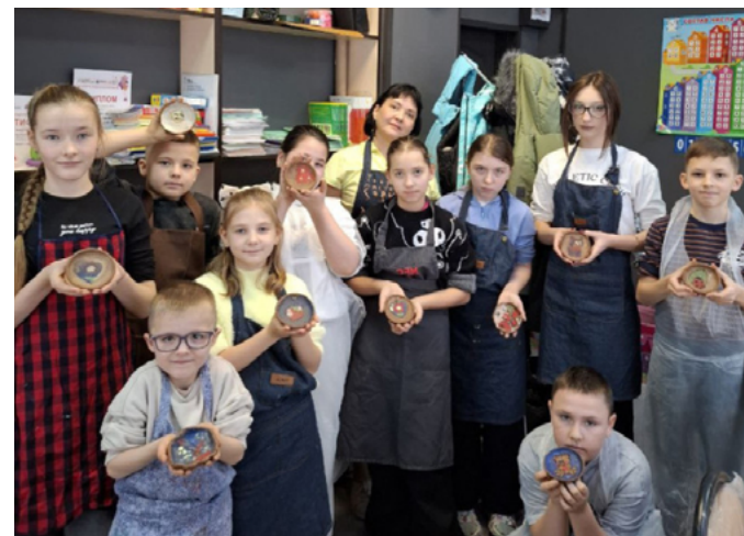
ВОЛОНТЕРЫ КАМЧАТКИ ПРОВЕЛИ ТВОРЧЕСКИЙ МАСТЕР-КЛАСС ПО ИЗГОТОВЛЕНИЮ ГЛИНЯНЫХ ТАРЕЛОК

Сданная кровь будет использована для оказания медицинской помощи нуждающимся, включая военнослужащих, проходящих лечение. Организаторы отмечают, что подобные акции проводятся на регулярной основе и вносят вклад в спасение жизней.