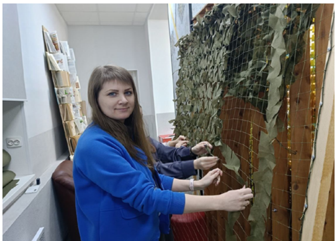
ВОЛОНТЕРЫ МУРМАНСКОЙ ОБЛАСТИ ПОДГОТОВИЛИ ДОПОЛНИТЕЛЬНОЕ ИМУЩЕСТВО ДЛЯ БОЙЦОВ СВО

В состав отправления вошли маскировочные сети в количестве 20 штук, а также 8 коробок с кашами и сухими супами. Груз доставлен непосредственно в воинские подразделения в зоне проведения СВО.