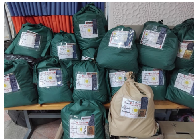
НАСТОЯТЕЛЬ ХРАМА В СИМФЕРОПОЛЕ ДОСТАВИЛ В ЗОНУ СВО МАСКИРОВОЧНЫЕ СЕТИ И СУХПАЙКИ

Сплетенные маскировочные сети были направлены военнослужащим в зону проведения СВО для выполнения боевых задач.