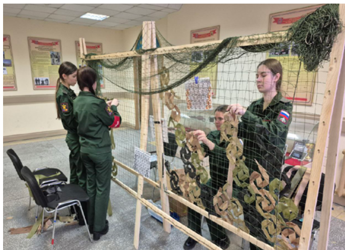
СТУДЕНТЫ СПБГЭУ СПЛЕЛИ МАСКИРОВОЧНЫЕ СЕТИ ДЛЯ УЧАСТНИКОВ СВО

Вилючинское отделение «Боевого братства» продолжает работу по сбору и доставке полезных грузов.