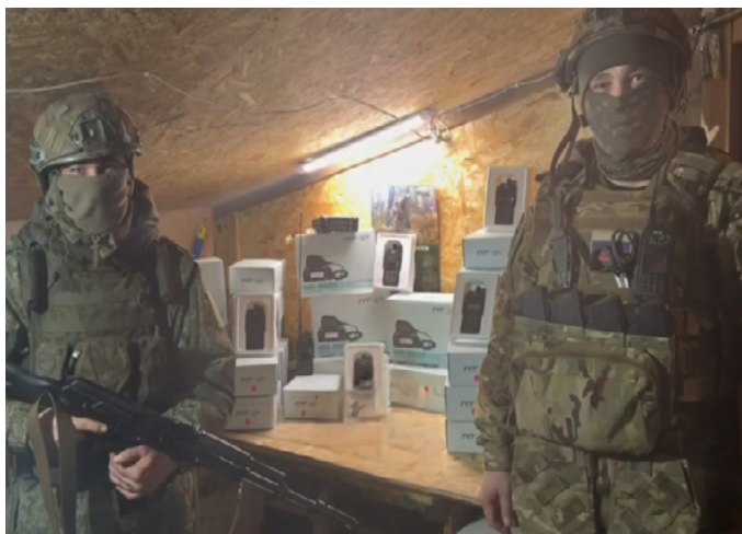
ВИЛЮЧИНСКИЕ ВЕТЕРАНЫ ДОСТАВИЛИ РАЦИИ И УСИЛИТЕЛИ БОЙЦАМ 40-Й БРИГАДЫ МОРСКОЙ ПЕХОТЫ

Ветераны СВО из Вилючинского местного отделения «Боевого братства» доставили полезный груз военнослужащим 40-й бригады морской пехоты, выполняющим боевые задачи на Донецком направлении.