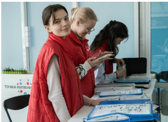
В СЕВАСТОПОЛЬСКОМ ГОСУДАРСТВЕННОМ УНИВЕРСИТЕТЕ ПРОШЛА АКЦИЯ «ДОБРОДОНОР»

Эта партия имущества в конце недели отправится в зону СВО к бойцам из Мурманской области.