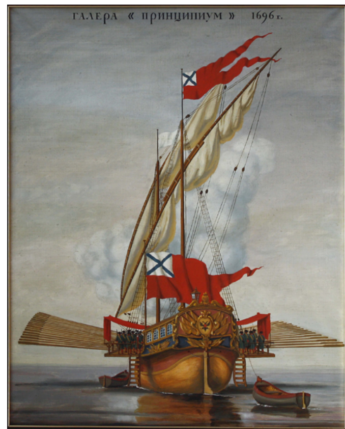
Е.В. Богданов. Галера «Принципиум».