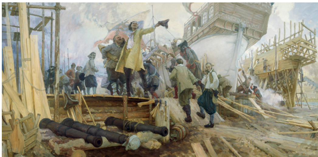
Ю. Кушевский. Спуск галеры «Принципиум» на воронежской верфи

Во время осады на галере держал свой флаг Пётр I. Благодаря эффективным действиям «Принципиума» и его собратьев, судьба крепости была предрешена. 19 (29) июля 1696 года Азов капитулировал. Это была первая крупная победа регулярного русского флота, доказавшая миру, что Россия стала морской державой. Галера «Принципиум» полностью оправдала свое имя, став «началом» будущего военного флота империи.