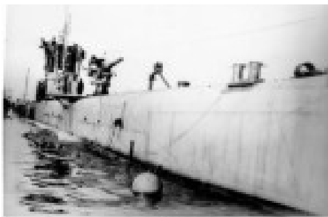
Подводная лодка «Волк»