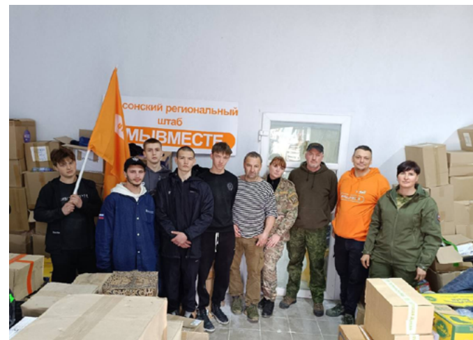
ВОЛОНТЕРЫ ОРГАНИЗАЦИИ «ДОБРО МИРА – ВОЛОНТЕРЫ КРЫМА» ПЕРЕДАЛИ ПАРТИЮ ПОЛЕЗНОГО ГРУЗА НА ФРОНТ

В числе груза оказалось трогательное письмо фронтовикам от женщин-вязальщиц из мезенской деревни Азаполье, где живет всего 60 человек, а шесть молодых парней участвуют в специальной военной операции.