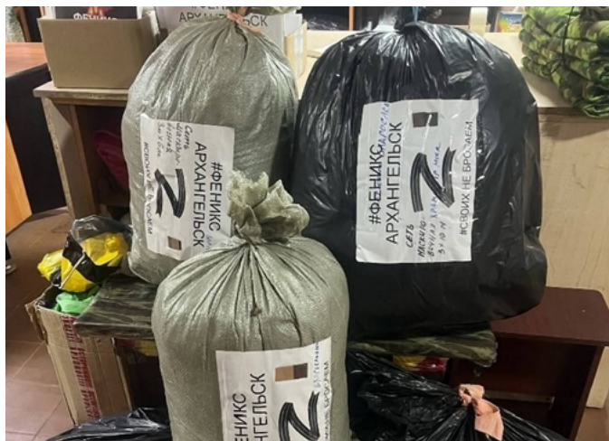
ВОЛОНТЕРСКОЕ ДВИЖЕНИЕ «ФЕНИКС АРХАНГЕЛЬСК» ДОСТАВИЛО НА СКЛАД ПЯТЬ МАСКИРОВОЧНЫХ СЕТЕЙ

Помимо средств маскировки, в состав груза войдут коробки с продовольствием, включая сладости, а также медикаменты и строительные материалы, необходимые для обустройства позиций и быта. Часть груза уже упакована, а часть будет подготовлена к отправке в ближайшую неделю и сразу же отправится на передовую.