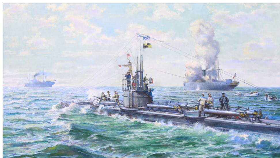
И.Н. Дементьев. Потопление подводной лодкой «Волк» 2-х германских транспортов 4 мая 1916 г. (ЦВММ)

Со второй целью, германским пароходом «Кольга» водоизмещением 2500 тонн, церемонились меньше: остановившись после предупредительных выстрелов, пароход внезапно бросился наутёк, что дало русским подводникам право открывать огонь на поражение. Пароход потопили, попав торпедой точно в середину корпуса — как гово-