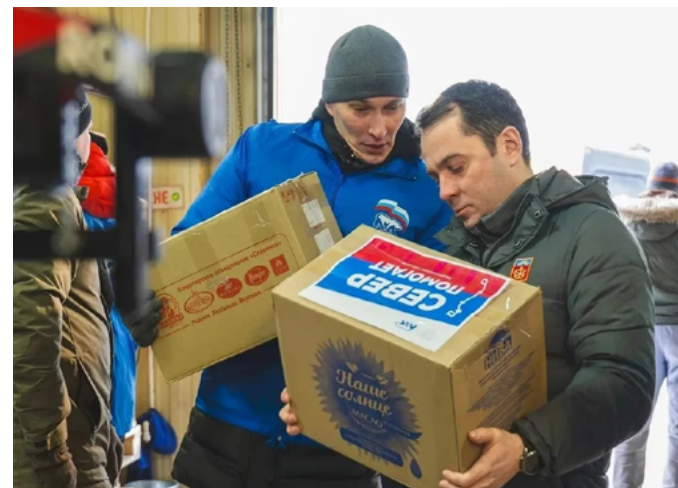
«СЕВЕР ПОМОГАЕТ»: ПРАВИТЕЛЬСТВО МУРМАНСКОЙ ОБЛАСТИ ПЕРЕДАЛО БОЙЦАМ 241 ТЫС. ЕДИНИЦ ИМУЩЕСТВА

Вся продукция регулярно отправляется в зону СВО.