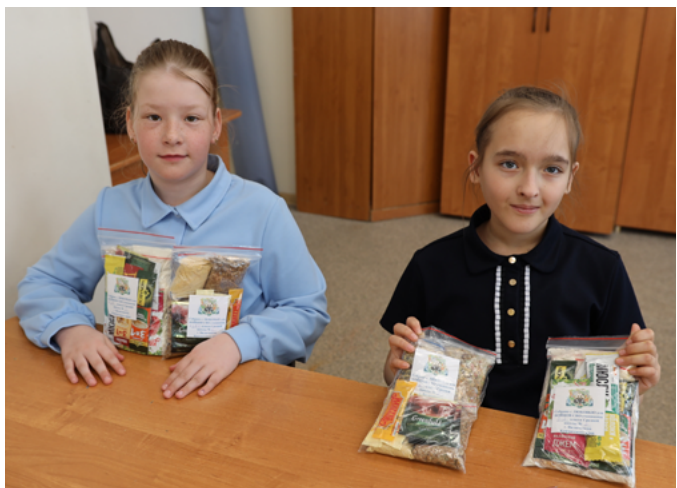
ШКОЛЬНИКИ КАМЧАТКИ ИЗГОТОВИЛИ СУХИЕ ПРОДУКТОВЫЕ НАБОРЫ ДЛЯ БОЙЦОВ В ЗОНЕ СВО

Отправку груза военнослужащим в зону проведения специальной военной операции волонтеры некоммерческой организации «Добро Мира – Волонтеры Крыма» осуществляют личным автотранспортом.