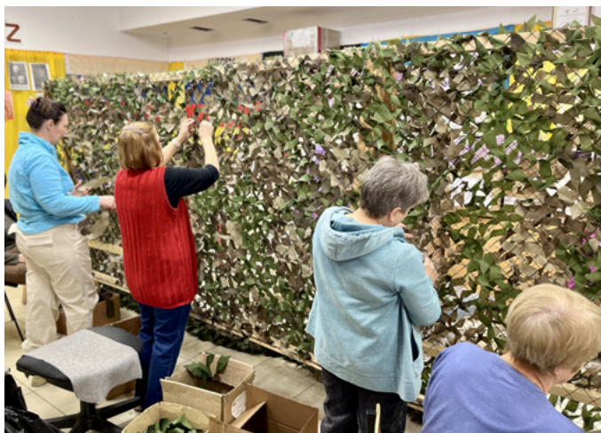
КАЛИНИНГРАДСКИЕ ВОЛОНТЕРЫ ПОДГОТОВИЛИ К ОТПРАВКЕ СРЕДСТВА МАСКИРОВКИ И ДРУГОЕ ИМУЩЕСТВО

Калининградские волонтеры из организации «Листва прикроет СВО» готовят для отправки очередной крупный сборный груз для военнослужащих. Бойцам планируется передать 350 маскировочных сетей.