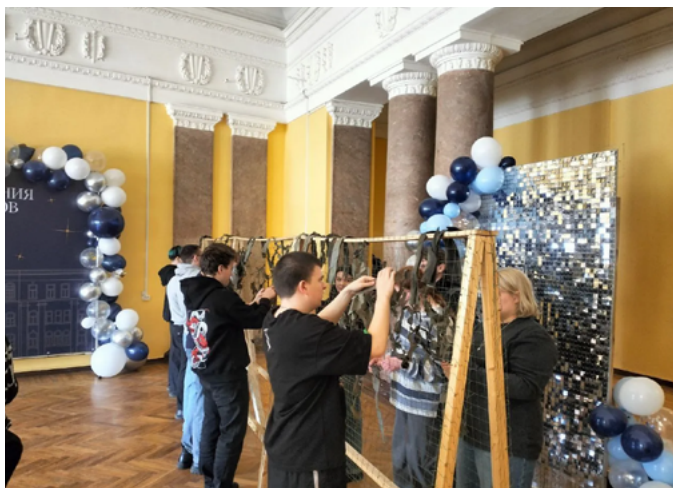
ВОЛОНТЕРЫ ШТАБА #МЫВМЕСТЕ И ВПК «СВЯТОГОР» В САНКТ-ПЕТЕРБУРГЕ ОТПРАВИЛИ ПАРТИЮ ПОЛЕЗНОГО ГРУЗА

Волонтеры-взрослые обучают детей технике безопасности и рецептурам; родительские комитеты помогают с логистикой и упаковкой.