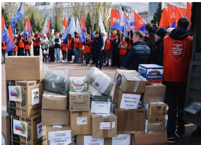
ИЗ АРХАНГЕЛЬСКА ОТПРАВИЛИ ОЧЕРЕДНУЮ ФУРУ С ПОЛЕЗНЫМ ГРУЗОМ В ДНР И ЗАПОРОЖСКУЮ ОБЛАСТЬ

Груз, собранный жителями региона, уже направляется к месту назначения. По пути фура заедет в Березник и Вельск, чтобы забрать дополнительные отправления. Отправка организована силами Губернаторского центра «Вместе мы сильнее» и регионального отделения партии.