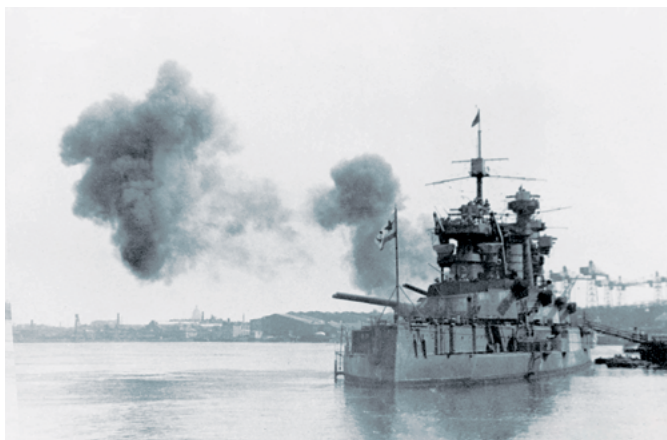
Линкор «Октябрьская революция» на защите Ленинграда. БФ. 1943 г.

За проявленные мужество и героизм 12 соединений, частей и кораблей флота удостоены звания гвардейских, 47 награждены орденами, 14 получили почётные наименования. 85 моряков удостоены звания Героя Советского Союза, трое из них дважды. В 1965 г. Северный флот был награждён орденом Красного Знамени.