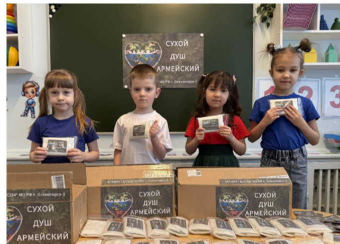
ВОСПИТАТЕЛИ И ДЕТИ МУРМАНСКОГО ДЕТСКОГО САДА СОБРАЛИ 150 НАБОРОВ СУХОГО ДУША ДЛЯ БОЙЦОВ СВО

Эта работа стала возможной благодаря активному участию и отзывчивости калининградцев.