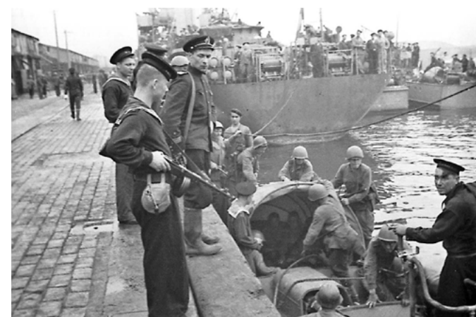
Морская пехота отправляется на прочёсывание берегов вокруг порта Расин. ТОФ. 1945 г.

Ход боевых действий на протяжении Великой Отечественной войны показал, что Военно-Морской Флот СССР справился со всем комплексом своих задач. ⚓