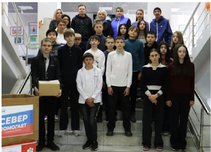
В МУРМАНСКОЙ ОБЛАСТИ ПРОДОЛЖАЕТСЯ СБОР ПОЛЕЗНОГО ГРУЗА ДЛЯ БОЙЦОВ СВО

Полезный груз отправится адресатам на следующей неделе в составе общего конвоя. Организаторы отмечают, что даже самые маленькие жители региона вносят свой вклад в поддержку военнослужащих. Работа по сбору помощи продолжается на регулярной основе.