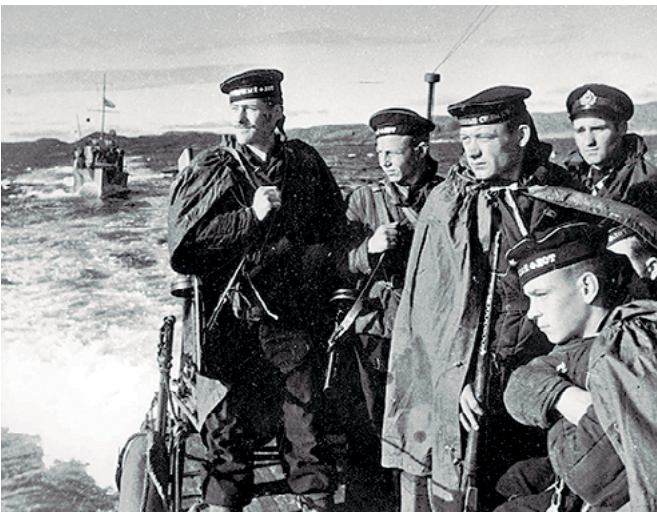
Морская пехота на переходе к месту высадки десанта. СФ. 1944 г.

Нашу страну во время Великой Отечественной войны обороняли четыре флота – Черноморский, Балтийский, Северный и Тихоокеанский, имелось несколько военных флотилий. Все они находились в разных условиях, что влияло на особенности проведения ими боевых операций. В годы войны Военно-Морской Флот направил на сухопутные фронты свыше 400 тыс. человек. В течение войны советский флот обеспечил перевозку по морским, озерным и речным коммуникациям 9,8 млн. человек (войск и гражданского населения), более 94 млн. т воинских и народнохозяйственных грузов.