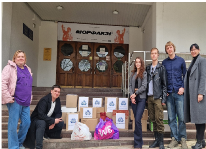
КРЫМСКИЙ ФЕДЕРАЛЬНЫЙ УНИВЕРСИТЕТ ПЕРЕДАЛ ПОЛЕЗНЫЙ ГРУЗ И ОБУЧИЛ СТУДЕНТОВ РАБОТЕ С БПЛА

Организаторы благодарят всех, кто принимает участие в сборе помощи. Депутат окружного совета отметил, что такая забота и надежный тыл очень важны для военнослужащих, выполняющих важные задачи в зоне СВО. Отправки продолжают на регулярной основе.