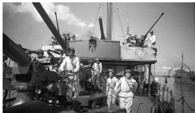
На корабле объявлена боевая тревога. ЧФ. 1942 г.

Черноморский флот был одним из самых подготовленных соединений Вооружённых сил СССР. Корабли Черноморского флота принимали участие в обороне Одессы, Севастополя, Новороссийска и в битве за Кавказ. Не только на море. Черноморцы пополняли ряды морской пехоты и гарнизонов, защищающих города. За ярость в бою немцы прозвали их «чёрной смертью». Свыше 54 тысяч моряков были награждены орденами и медалями Советского Союза. 227 черноморцев стали Героями Советского Союза.