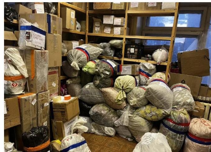
ВОЛОНТЕРЫ ГРУППЫ «ЗАМИР АРХАНГЕЛЬСК» ПЕРЕДАЛИ ПОЛЕЗНЫЙ ГРУЗ В ЗОНУ СВО

Они изучили FPV-дроны, бронезащиту и тактическую медицину, а затем применили навыки в лазертаге.