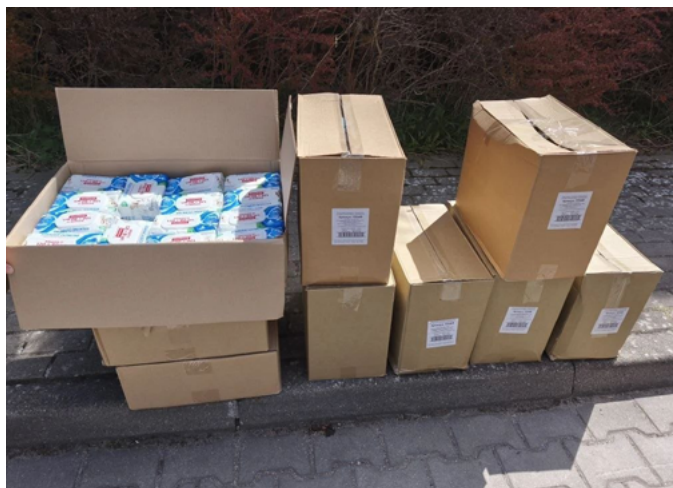
ВОЛОНТЕРЫ КАЛИНИНГРАДА ОРГАНИЗОВАЛИ СБОР ДОПОЛНИТЕЛЬНОЙ ПОМОЩИ ДЛЯ УЧАСТНИКОВ СВО

Фура сформирована при участии волонтерских организаций области. К работе также присоединились участники программы «Защитники. Под крылом Архангела» – они точно знают, какая помощь сейчас нужна на передовой.